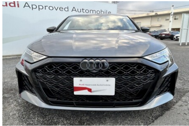
Audi Approved Automobile